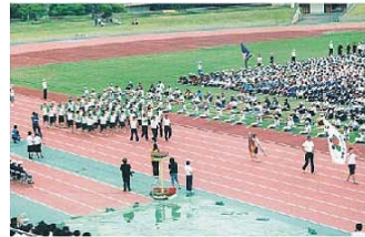
6月/県高校総合体育大会