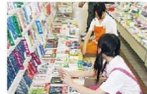
7月/インターンシップ