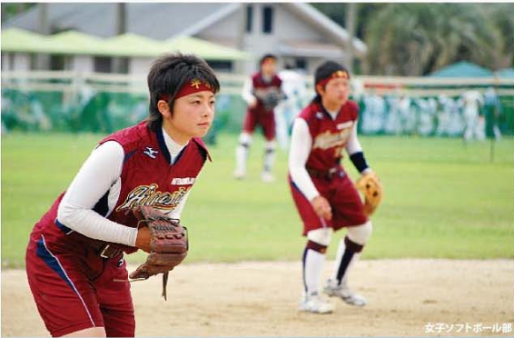
女子ソフトボール部