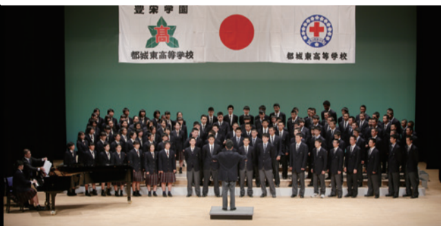
学科対抗合唱コンクール