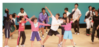
部活動生による創作ダンス