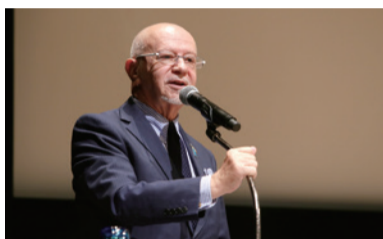
講演するマンリオ・カデロ閣下

しての特別講演があり、講演後には、カデロ閣下の著書「世界が感動する日本の当たり前」を読んだ感想文表彰もあり