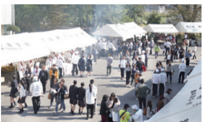
来校者でにぎわう調理科の屋台村

ました。午後からは、各科対抗の合唱コンクールや生徒有志によるダンスや歌の披露がありました。