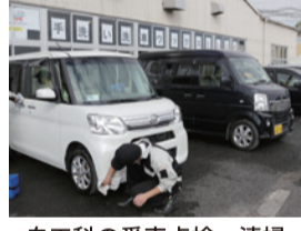
自工科の愛車点検・清掃