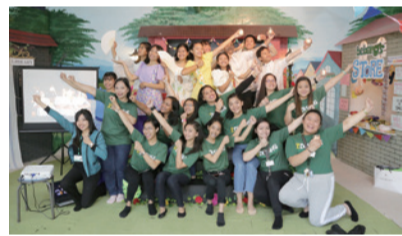
ヴィラの楽しさをアピールする留学生ら

います。ここには、さまざまな英語の図書を取りそろえた「英語図書館」があるのはじめ、英語の映画やミュージックビ