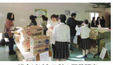
総合ビジネス科の野菜販売