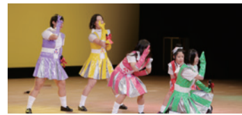
恒例のももクロパフォーマンス