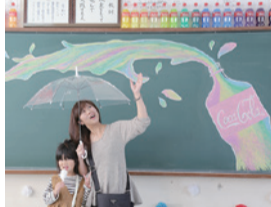
普通科の黒板アート