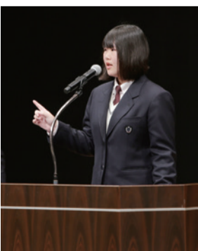
英語スピーチコンテスト