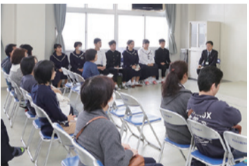
中学生の英語スピーチコンテスト

ました。午後からは、各科対抗の合唱コンクールや生徒有志によるダンスや歌の披露がありました。