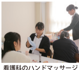
看護科のハンドマッサージ